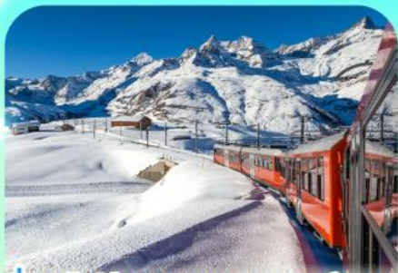
นั่งรถไฟสู่ยอดเขากรอนเนอส์เกรต

สวยสะท้านฟ้าที่สวิสฯ สะกิดรักที่โดมโบ พิชิตเขาแมทเทอร์ฮอร์นและจุงเฟรา